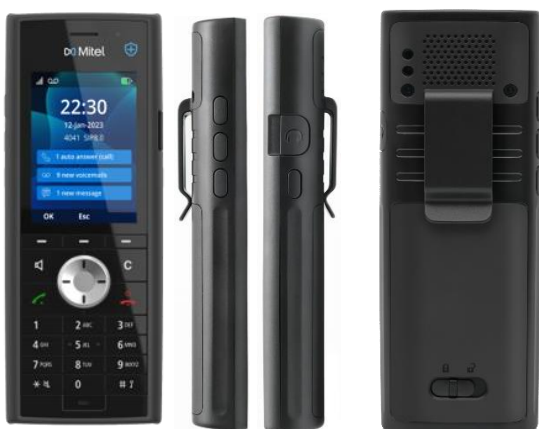
*Mitel 722dt DECT-Mobilteil

Die Funktions- und Firmware-Updates halten die Mobilteile Over-the-Air auf dem neuesten Stand. Die neue 700d DECT-Serie arbeitet mit den bestehenden 600d DECT-Mobilteilen und Mitel SIP DECT-Basisstationen zusammen, da sie die gleichen RFPs haben. Nutzen Sie Ihre bestehenden Investitionen in die Mitel-Infrastruktur – Sie müssen sie nicht ständig ersetzen.